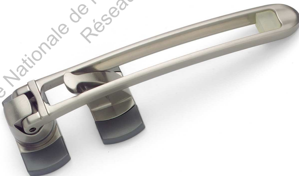
Entrebâilleur de sécurité pour porte « Most »

Le seul entrebâilleur rabattable verticalement contre l'huissierie en position repos : esthétique, faible encombrement, évite la fermeture inopportune de la porte (courant d'air, enfant, animal domestique).