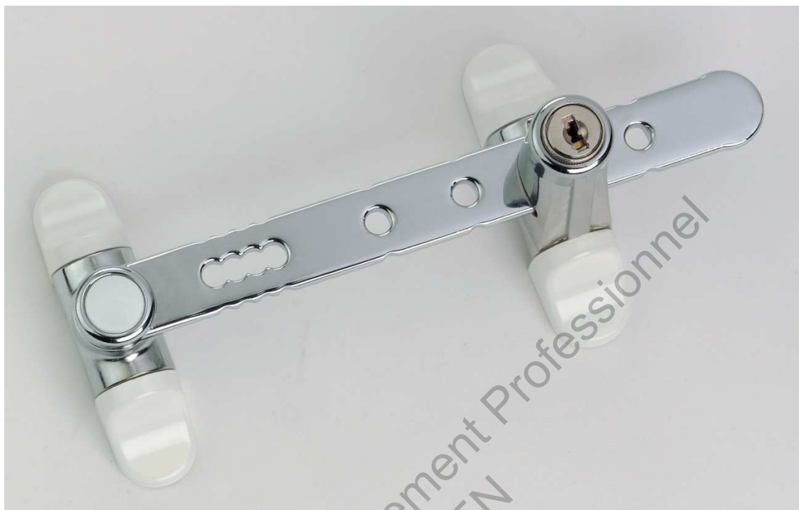
Entrebâilleur de sécurité pour fenêtre « Airlock »

Version à clé : sécurité maximale contre les risques de défenestration et de vol (antivol). Version idéale pour la prévention dans les collectivités (écoles, hôpitaux, maisons de retraite). Existe également en version à bouton poussoir.