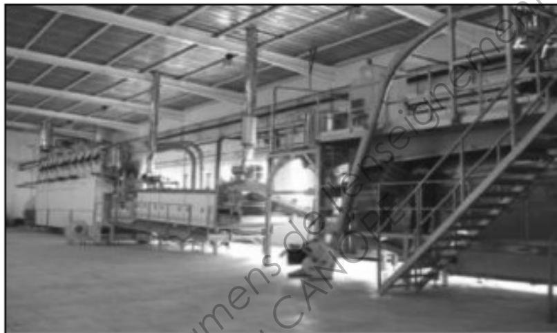
Ligne de production Clextral (exemple)

Plus de 13 000 systèmes CLEXTRAL sont actuellement installés dans 87 pays. CLEXTRAL emploie 227 personnes au sein du groupe Legris Industries qui compte 2 800 employés.